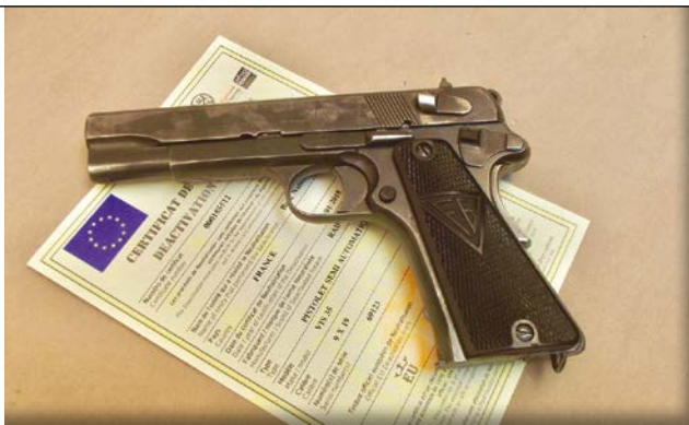
Les personnes ayant acquis une arme neutralisée ou ayant fait neutraliser une arme entre le 13 juin 2017 et le 1 er août 2018 doivent en faire la déclaration conformément à l'Art. R312-56 du CSI, au plus tard le 14 décembre 2019.

France peut se classer soit en C 5° (neutralisation avant le 13 décembre 1978) ; soit en C 5°, mais avec le bénéfice d'un régime antérieur donc considéré comme étant en C 9° jusqu'à sa cession (neutralisation entre le 13 décembre 1978 et le 6 avril 2016, avec acquisition avant le 6 avril 2016) ; soit en C 5° (neutralisation entre le 13 décembre 1978 et le 6 avril 2016, avec acquisition après le 6 avril 2016) ; soit en C 9° (neutralisation après le 6 avril 2016). En l'absence de neutralisation reconnue, on notera que le fusil Mauser 1898 n'est pas classé en C 1° b (ni en D e) mais en C 5°, contrairement au classement généralement appliqué par les préfetures, car il fait partie de la liste des armes surclassées par arrêté. La pratique est parfois éloignée de la théorie... Quoi qu'il en soit, le titulaire d'un titre d'acquisition d'armes de catégorie C (tireur, chasseur, collectionneur...) qui achète des armes neutralisées a tout intérêt à