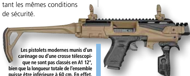
Les pistolets modernes munis d'un carénage ou d'une crosse télescopique ne sont pas classés en A1 12°, bien que la longueur totale de l'ensemble puisse être inférieure à 60 cm. En effet, il s'agit avant tout d'armes de poing. C'est aussi le cas des pistolets plus anciens tels que les Mauser C96 ou les Luger avec leurs étuis d'épaulement...

poing à percussion annulaire à 1 coup. Et un club de 1500 adhérents peut détenir jusqu'à 90 armes entrant dans les quotas, et 20 pistolets .22 LR à 1 coup supplémentaires. Aussi, les clubs détenant au maximum 5 armes toutes catégories confondues bénéficient d'un assouplissement : désormais, seules les carcasses ou les parties inférieures des boîtes de culasse doivent être conservées dans les installations des clubs de tir. Les autres éléments d'armes peuvent être conservés en dehors, mais en respectant les mêmes conditions de sécurité.